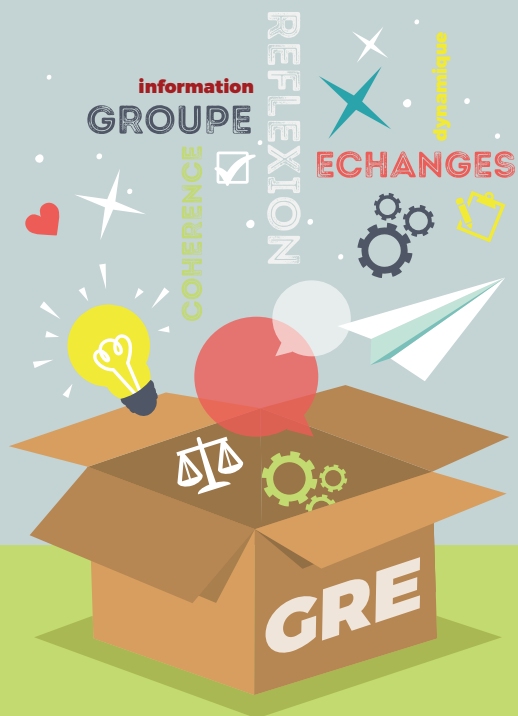
CARTE DES GRE

La démarche palliative auprès des enfants nécessite l'intervention de nombreux acteurs. Afin de permettre une dynamique d'échanges et discussions autour de ces situations complexes et d'assurer un même niveau d'information de chaque intervenant, de l'usager et de son entourage, l'Equipe Ressource Régionale des Soins Palliatifs Pédiatriques (ERRSPP) en partenariat avec les structures présentes sur la région propose dans les différents départements de Bretagne des Groupes de Réflexion et Echange (GRE).